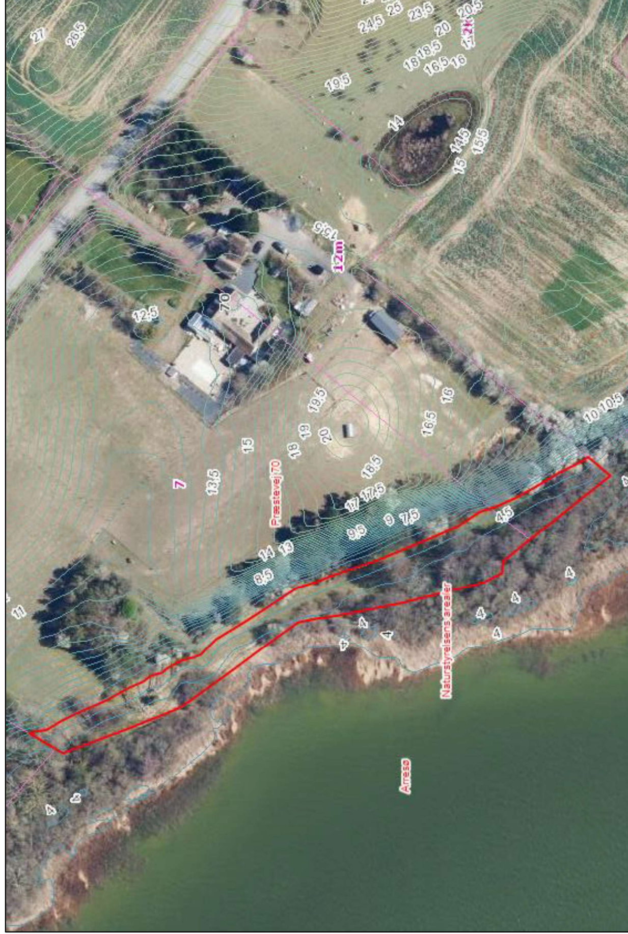
Bilag 1: Luftfoto fra 2022 med markering af område som afgørelsen vedrører (rød polygon). Kortet indeholder også 0,5 meter højdekurver og et matrikelkort. Polygonen skal vise, at afgørelsen vedrører de sønære dele af matrikel nr. 12m og 7, nedenfor skrænten.